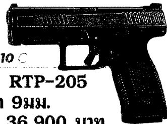
CZ P-10 C