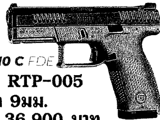
CZ P-10 C FDE

ใบอนุญาต ป.ร.ระบุ "สวัสดิการสำนักงานตำรวจแห่งชาติ (สกบ.)"